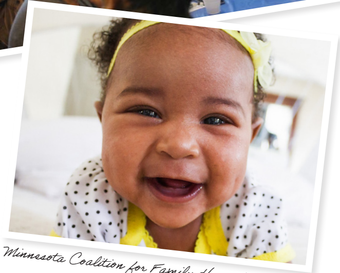
Minnesota Coalition for Family Home Visiting