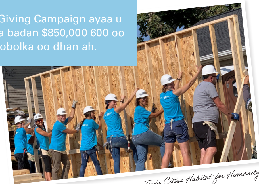
Twin Cities Habitat for Humanity

Community Giving Campaign ayaa u ururiyay in ka badan $850,000 600 oo samafal ah gobolka oo dhan ah.