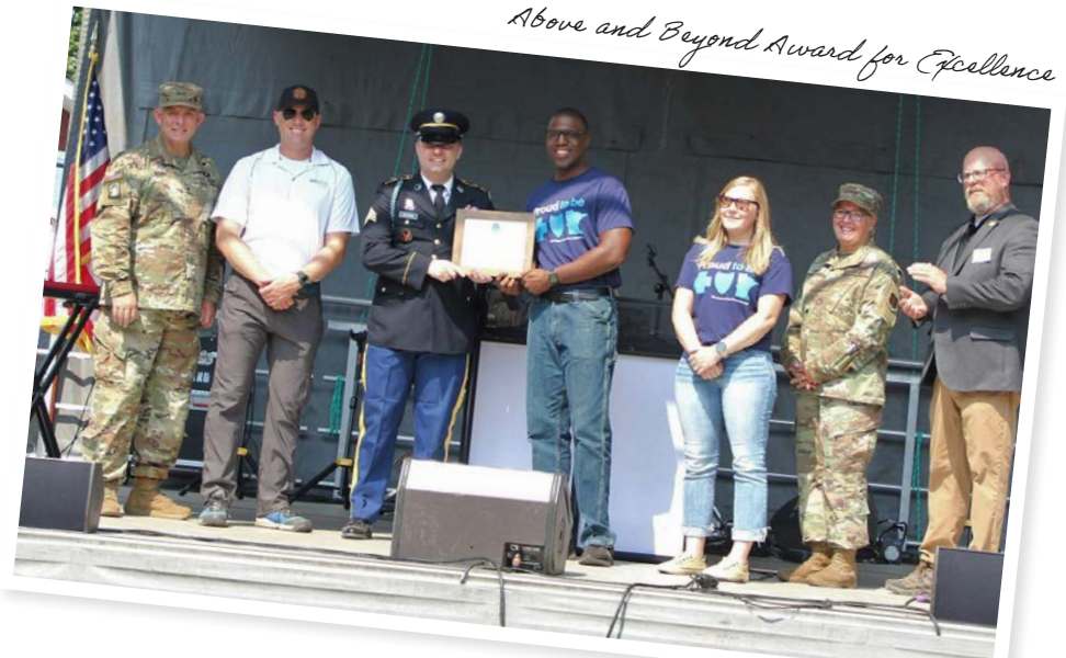
Above and Beyond Award for Excellence

Employer Support of the Guard and Reserve (ESGR) waxay u aqoonsatay Blue Cross heer sare bixinta dheefaha shaqaalaha u adeega ciidamada iyo xubnaha qoyskooda sanadka 2023.