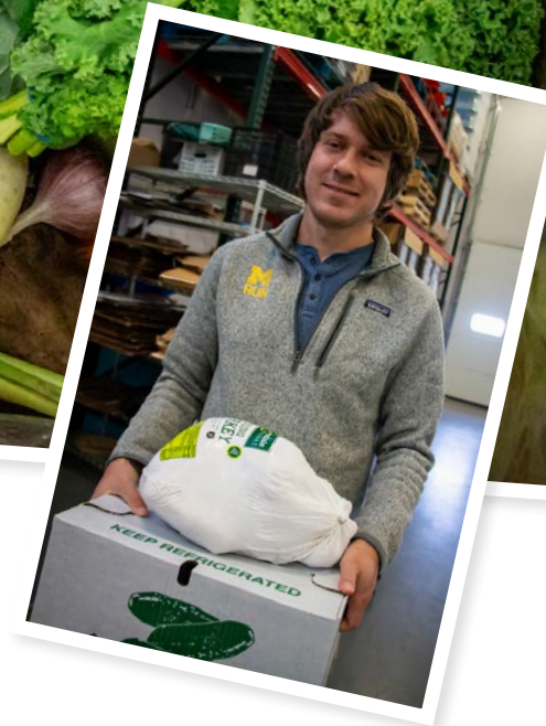
Among American Farmers Association