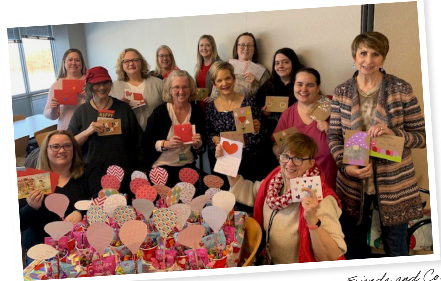
Friends and Co.

Isticmaalka shaqada iskaa wax u qabso ah, wadooyinka waxay ku kacayaan kaliya saddex goobaad waxa ay caadi ahaan ka heli karaan qandaraasle dhaqameed.