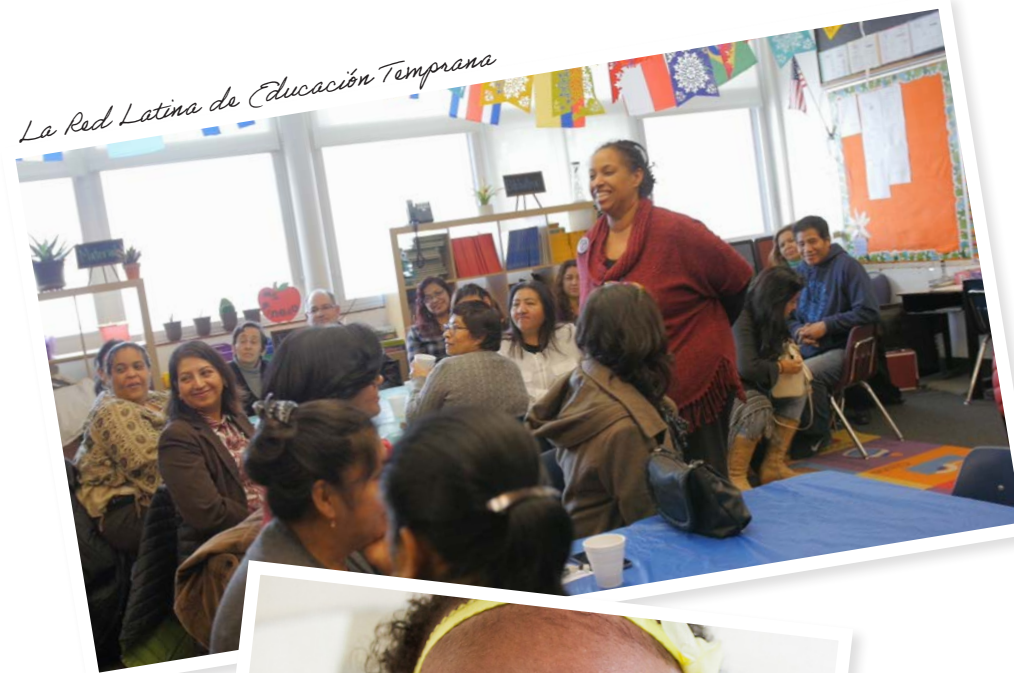
La Red Latina de Educación Temprana