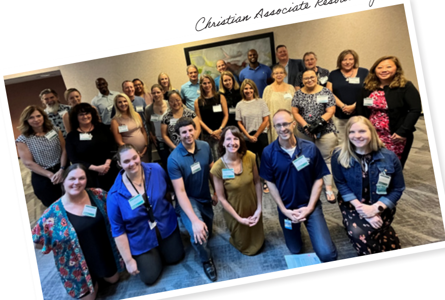
Christian Associate Resource Group

Women’s Network waxay leedahay himilo ah inay ka dhigto Blue Cross goobta ugu wanaagsan ee lagala shaqeeyo xulafada haweenka. Waxay bixiyaan fursado ay ku samaysan shabakada, ku hormaraan, wax ku bartaan, ku sameeyaan isbeddel wanaagsan oo ay siiyaan fikirado hogaanka shirkada. Sanadka oo dhan waxay bixiyaan madalo ay ku kulmaan hogaamiyeyaasha haweenka, iyo sidoo kale hawlaha iyo munaasabadaha kale. Intaa waxaa dheer, waxay baaraan horumarka shakhsi ahaaneed waxayna ka shaqeeyaan sidii ay caqabada uga gudbi lahaayeen si loo helo goob shaqo iyo aduun isu-dheelitiran jinsiga iyo isir ahaanba.