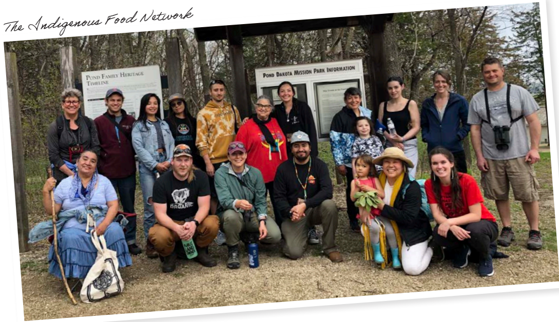
The Indigenous Food Network

Waxaa hogaamiya Dream of Wild Health, IFN waxay isu keentaa ururo ay hogaamiyaan dadka dhaladka ah si ay uga wada shaqeeyaan dib u dhiska nidaamka cuntada madaxbanaanida ee bulshada dhaladka ah ee Twin Cities. Sanadka 2023, IFN waxay qabatay 61 fasalo iyo hawlo ururada la shaqeeya, dhalinyarada dhaladka ah, qoysaska, iyo xubnaha bulshada. IFN waxaa sidoo kale oo ay taageertay munaasabadaha bulshada deegaanka ee diirada lagu saaray caafimaadka dadka dhaladka ah ah, oo ay ku jirto Dabaaldega Madaxbanaanida Cunnada ee Phillips halkaas oo ay ku qaybiyeen 1,110 dhir ah oo ay ku bixiyeen qado caafimaad oo bilaash ah, iyo Native American Community Clinic Harvest iyo Health Fair halkaas oo ay u qaybiyeen in ka badan 1,500 rodol oo cunto loo talagalay 210 qof.