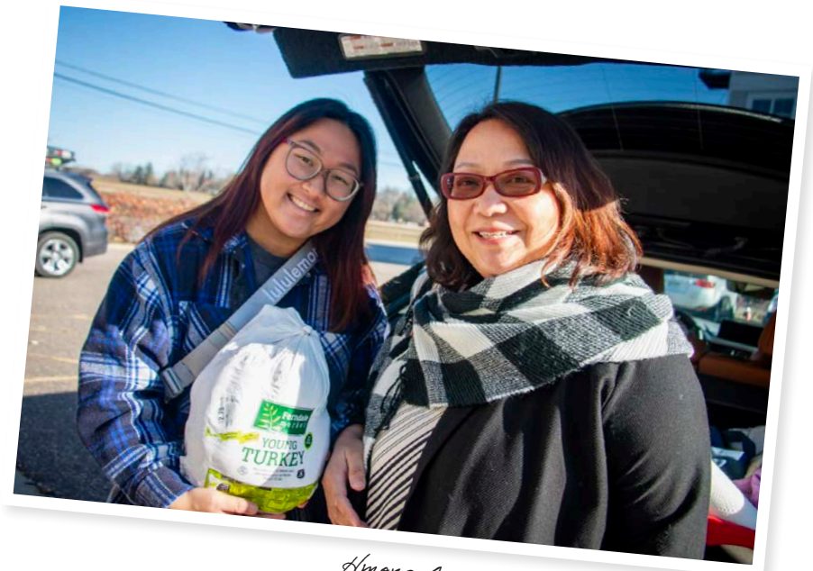
Hmong American Farmers Association

Hmong American beeralayda Association (HAFA) waxaa ka go'an inay horumariyaan barwaaqada beeralayda Hmong ee Maraykanka ah iyo qoysaskooda iyada oo loo marayo horumarinta dhaqaalaha, kobcinta awooda, iyo horumarinta iskaashatooyinka, u dooditaan iyo cilmi-baarista si loo kobciyo isdhexgalka iyo hantida bulshada. Iyada oo qayb ka ah habraacooda isku dhafan, HAFA waxay maamushaa beer 155-hektar ah oo ku taal Dakota County halkaas oo qoysaska xubnaha ka ahi ay ku kirayn karaan dhul, ay horumariyaan ganacsigooda iyo dhaqankooda beeralayda, oo ay ka iibiyaan wax soo saarka Goobaha Cuntada ee HAFA, gaarista dugsiyada, tafaariiqlayda, iyo machadyada kale.