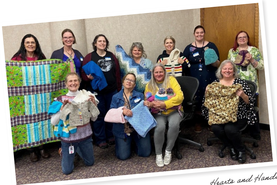
Hearts and Hands