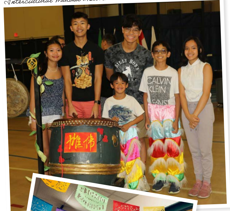
Intercultural Mutual Assistance Association

Iyada oo loo marayo Xiriirada Caafimaadka leh, Blue Cross Foundation waxay la shaqeyneyaan iskaashato deeq bixiyayaal ah si ay u dhisto isku xirnaanta bulshooyinka iyo jiilalka dhexdooda, ciribtirka sinaan la'aanta taas oo faragelisa xiriirka bulshada iyo taageerada dadaalada wax looga qabanayo dhaawacyada bulshada. Shaqadani waxay caawisaa abuuritaanka iyo kobcinta bulshooyin isku xidhan, adkaysi leh oo loo wada dhan yahay halkaas oo dadka oo dhami ay la kulmaan dareenka kamid ahaansho.